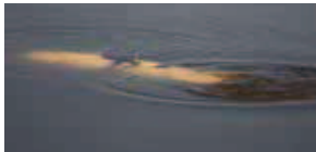
Een onderwaterdrone met sensoren (boven) is in de zomer van 2015 ingezet om voor Rijkswaterstaat onderzoek te doen naar de waterkwaliteit bij het eiland Tiengemeten